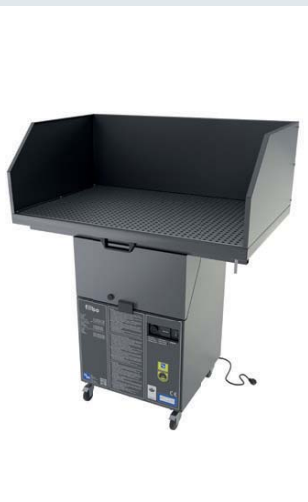
Table de travail mobile