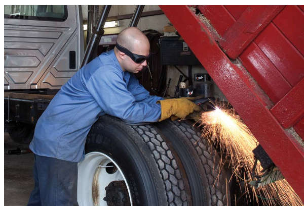
Réparation et modification de véhicules