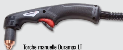
Torche manuelle Duramax LT